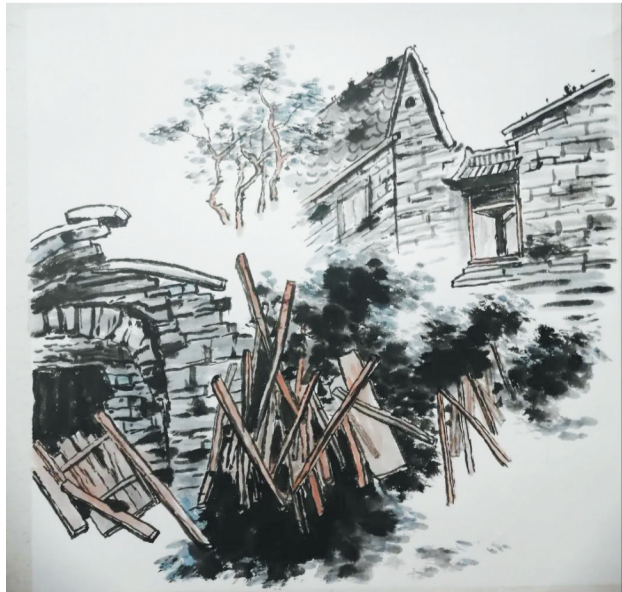
绘画作品《山乡一隅》 车胜新