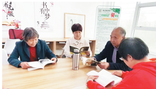
村民们在农家书屋浏览图书。

2021年,为进一步夯实基层文化阵地建设,构建群众参与、享受文化的“新地标”,淄川区在不断完善图书馆总分馆建设的基础上,重点打造5个图书馆服