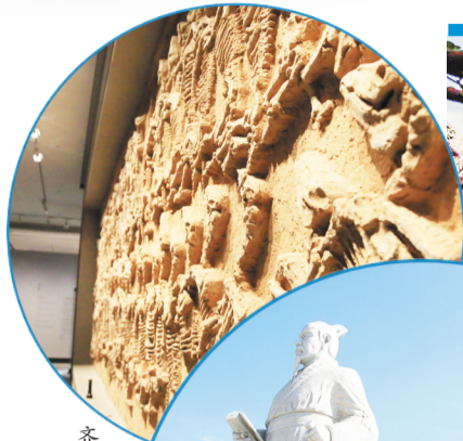
齐文化博物馆展出的狗马坑