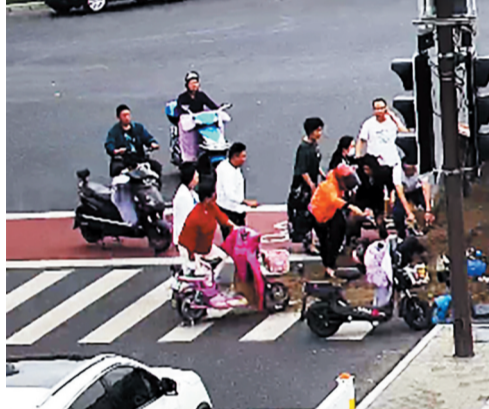
三轮车侧翻后,满载的沙子埋住了旁边两人,过路市民迅速赶来救人。视频截图