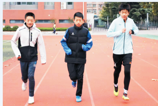
10月16日早晨,张店区实验中学的学生到学校跑步锻炼。