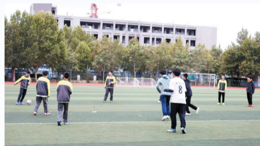
10月16日是周六,学生们一早到学校踢足球。