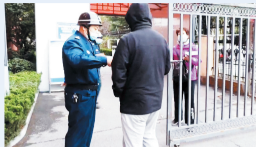
10月16日一早,附近居民到张店区实验中学锻炼,按照疫情防控要求,进门要先测温。