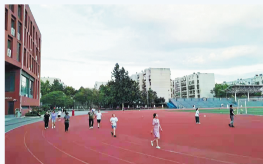
10月16日晚饭后,居民在张店区实验中学健身。