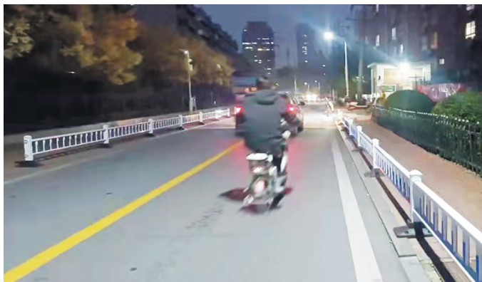
此前，周边小区居民路边乱停车，导致小巷很堵(上图)。安装护栏后，小巷乱停车问题得到解决(下图)。

节，有问题我们从来不会回避，我们将主动担当、积极作为、向前一步，让城市变得更加和谐宜居。”面对群众的感谢，谭延聆表示，城市干净有序，居民生活幸福是作为城市管理者最乐意看到的。