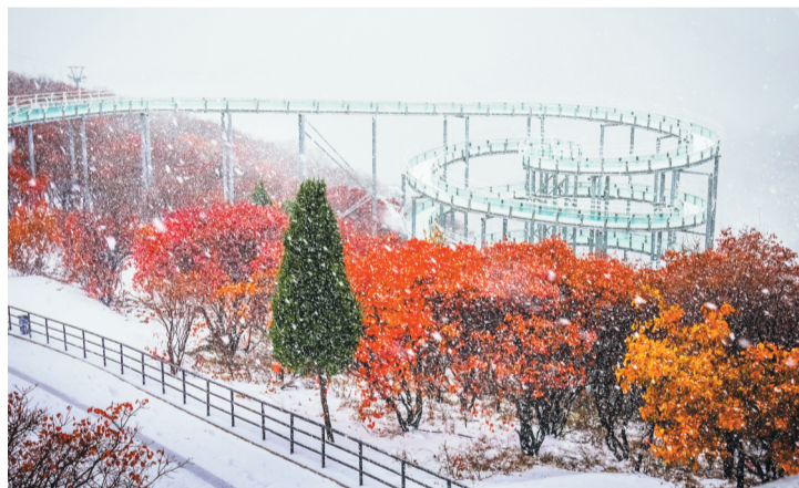
红叶柿岩雪景