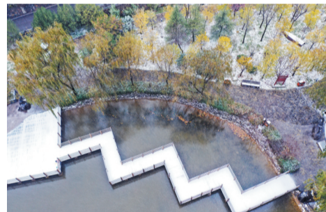
潭溪山雪景 大众日报淄博融媒体中心记者 杨峰 通讯员 崔新程