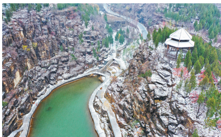
潭溪山雪景