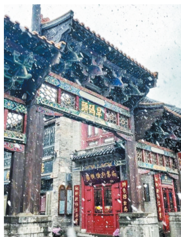
雪后旱码头