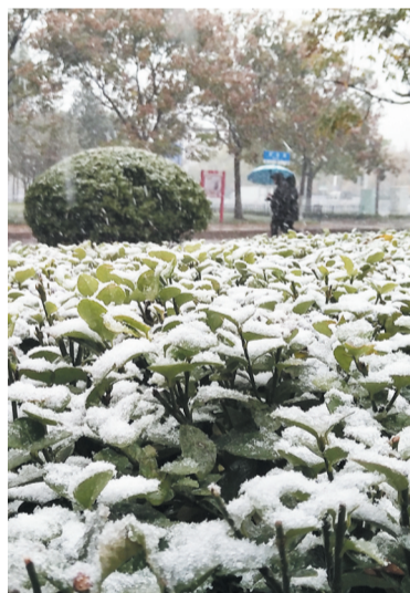
11月7日中午,淄博中心城区路旁绿植覆盖着白雪。大众日报淄博融媒体中心记者 孙渤海 通讯员 孙燕玲