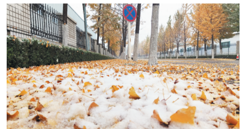
淄博高新区的大街上落下雪花。大众日报淄博融媒体中心记者 伊巍 潘赞名