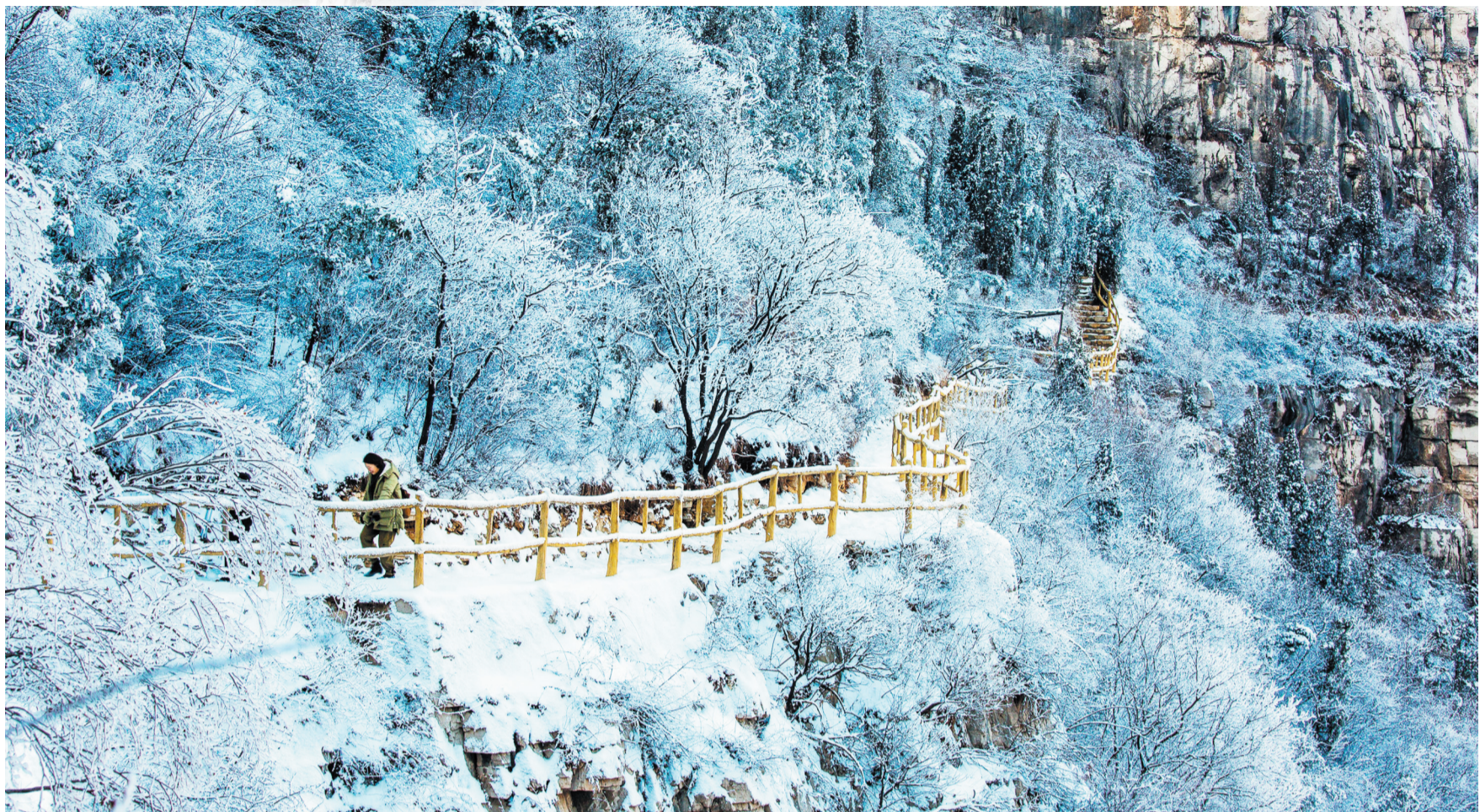
雪后的齐山银装素裹,分外美丽。通讯员 范芬

立冬迎大雪,瑞雪兆丰年。11月7日,立冬,淄博迎来今冬第一场雪。这场降雪自雨夹雪开始,逐步演变成大雪。从山区到城市,淄博被皑皑白雪覆盖,从空中俯瞰,宛若童话世界。