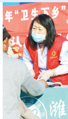
医务人员向村民讲解健康注意事项。