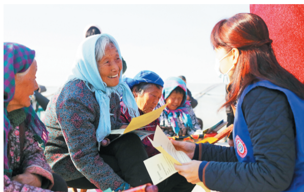
淄博市卫生健康监督执法局的工作人员为村民发放健康知识宣传页。