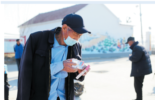
领到免费药品的村民正在看用药说明。