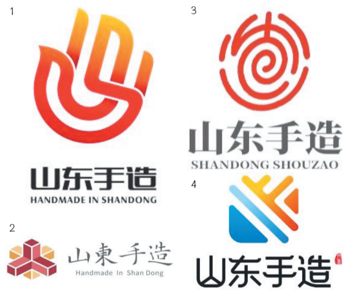
图4 作者:山东快马加鞭网络科技有限公司