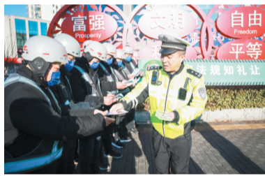
张店交警联合代驾公司给代驾小哥开展定向安全学习教育活动。

12月2日是第十个122“全国交通安全日”，今年的主题是“守法规知礼让、安全文明出行”。12月1日上午，淄博市举行“全国交通安全日”主题宣传教育活动启动仪式。即日起，淄博市部署开展群众性主题交通安全宣传教育活动，突出“安全”和“文明”主基调，围绕说变化、汇力量、育文化、展形象的工作思路，重点策划推进“四大活动”，从源头上预防和减少道路交通事故，进一步增强群众出行的安全感、幸福感和获得感。