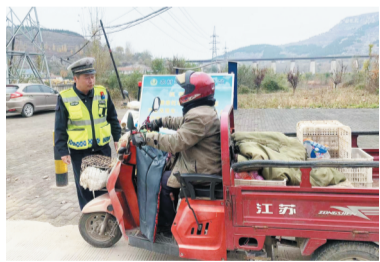
博山交警依托山区农村交通安全劝导站向过往群众进行安全劝导。