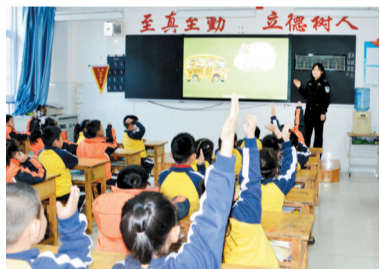
高新区交警走进辖区小学，为孩子们讲解交通安全知识。