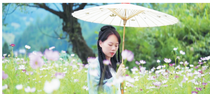
小喜制作的油纸伞

看完视频，网友纷纷到阿木爷爷的主页下留言“膜拜”。英语、葡萄牙语、西班牙语、韩语、日语……来自世界各地的溢美之词迅速“占领”了评论区。有网友直呼阿木爷爷是“鲁班转世”。一名建筑师网友感叹：“阿木爷爷没有制图软件(CAD)，却能在自己的