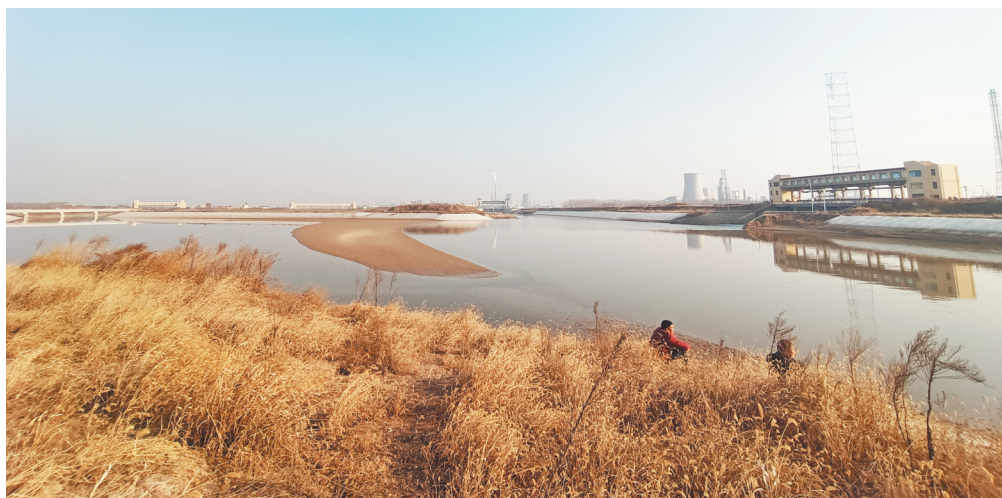
高青县小清河防洪综合治理工程完工后的主航道和分洪道

增加到118米,深度增加1.4米。在分洪道拐弯的地方,全部用预制块进行硬化处理,增加强度,加大对岸坡的防护,也减少了漫滩滑坡风险,增强抗洪排洪的防御能力。