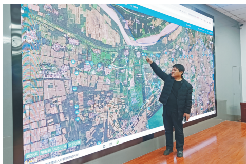
高青县智慧水利管理平台