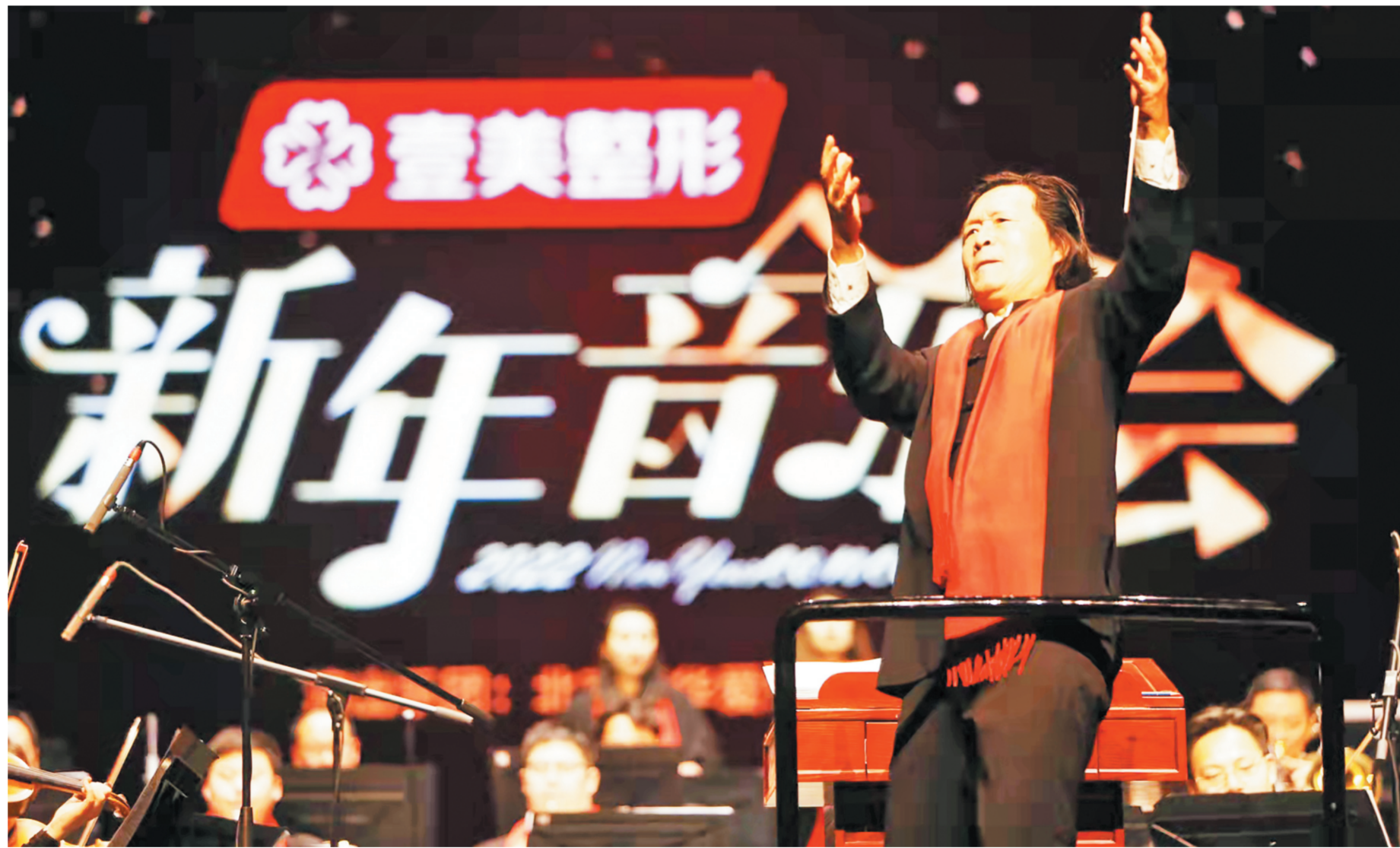
此次音乐会由著名指挥家、音乐教育家刘凤德执棒。