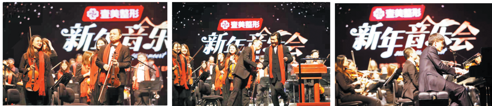
演出结束后，音乐家们起身致谢。