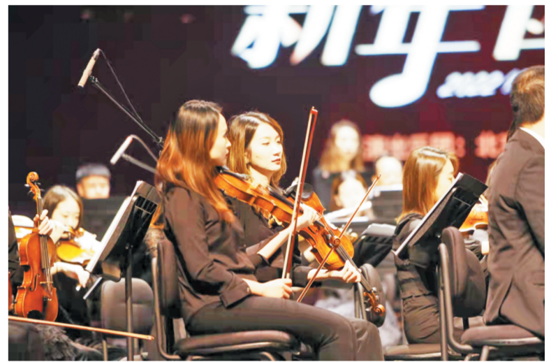
来自北京东华爱乐乐团的音乐家们