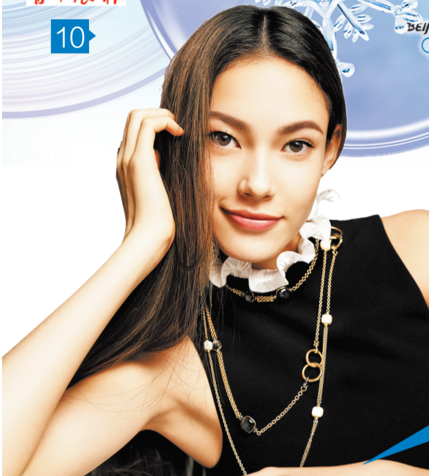
谷爱凌为时尚杂志拍摄的照片