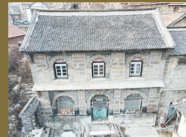
殷家大院里的二层石楼,建造工艺十分考究。