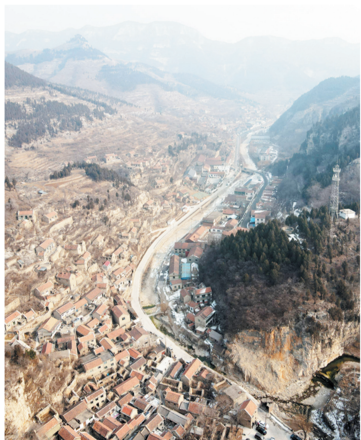
从空中俯瞰石门村,民居都是沿河而建。