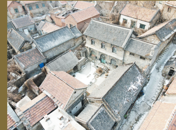
从空中俯瞰殷家大院,是典型的四合院结构。