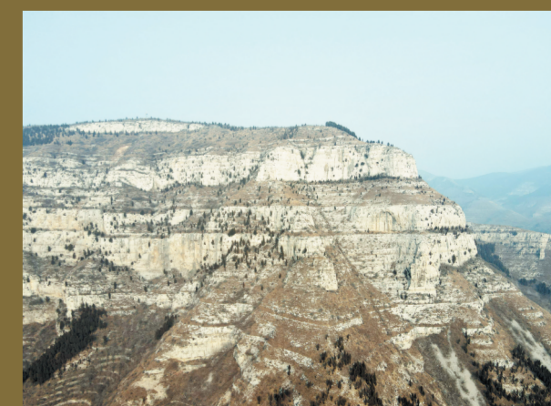
呈阶梯状的夹谷台