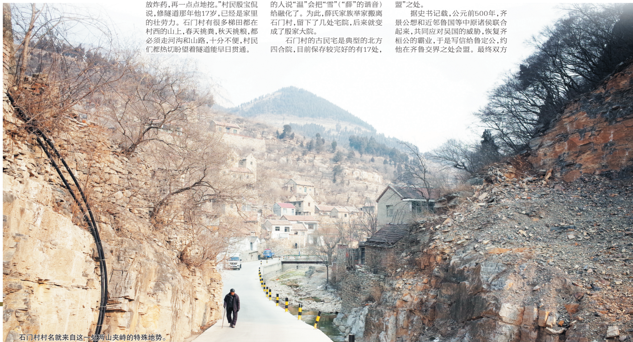
石门村村名就来自这一处两山夹峙的特殊地势。