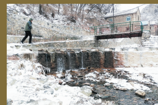
虽然已是深冬,但村中小河依然流水潺潺。