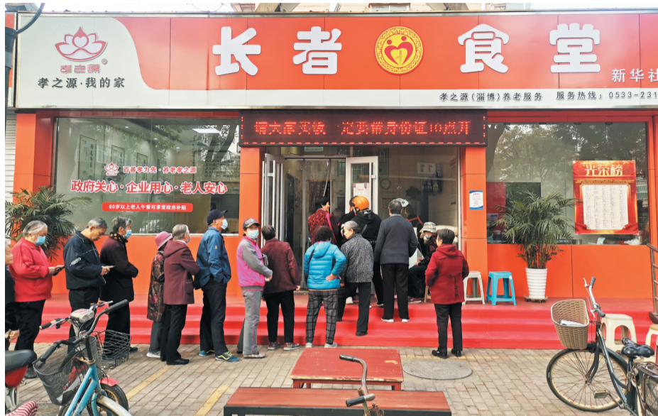
“红色合伙人”打造的长者食堂解决了老年人的一餐热饭。