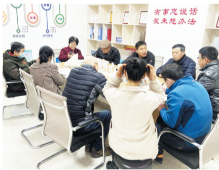
每周一，社区召集居民、物业公司、居委会召开“阳光议事会”。