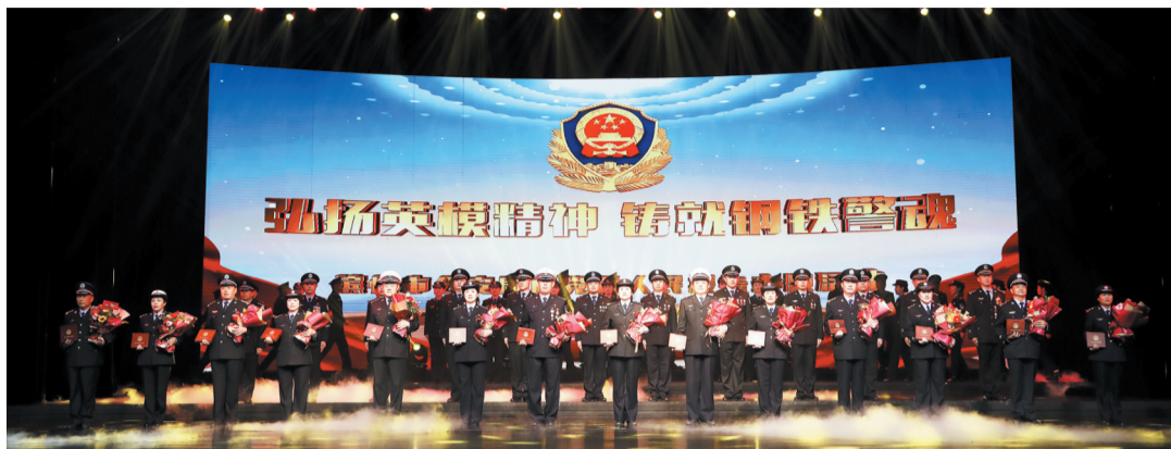
滨州市公安局举行英模事迹报告会。