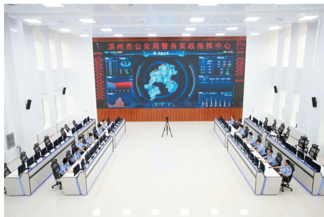
滨州市公安局警务实战指挥中心