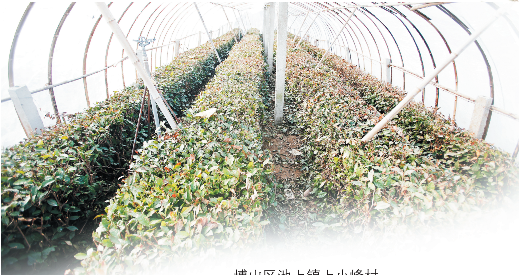
村中大棚里种植的茶树