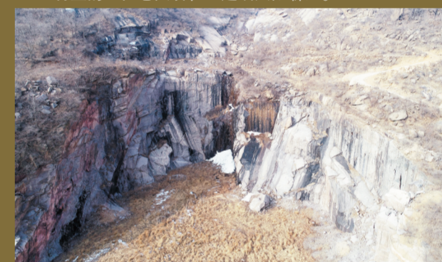
村西山上多年前开采大理石留下的痕迹,将来或许会被开发成景点。