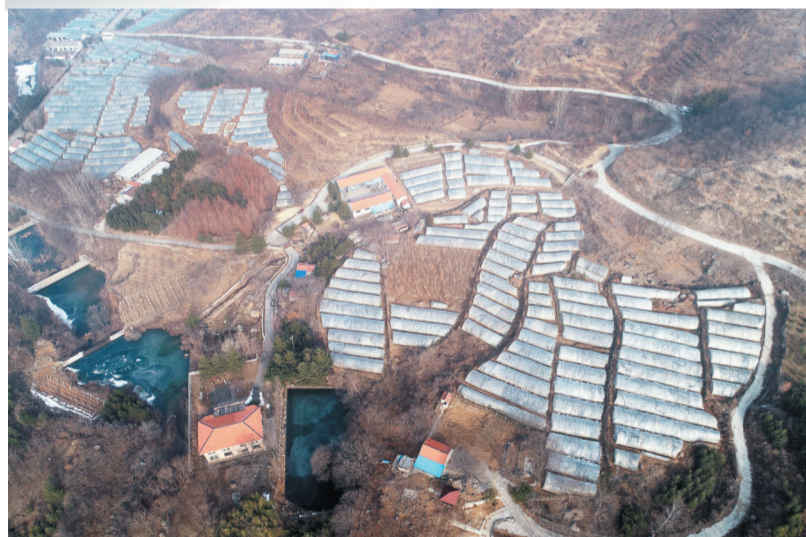
村中建了鳞次栉比的茶叶大棚,上小峰村绿茶种植面积有近400亩。