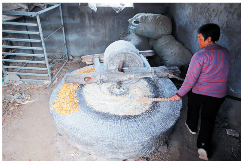
一位老人用石碾加工玉米面。