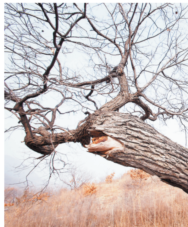
村东山中的“板栗王”树干已出现断裂。