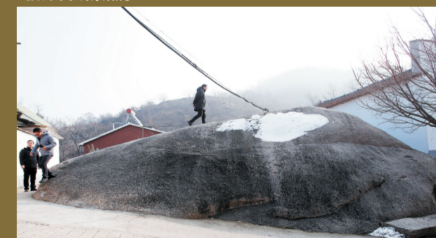
村中这样的巨石有不少。