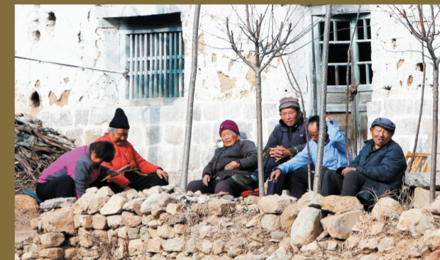
村里的几位老人凑在一起晒太阳聊天。