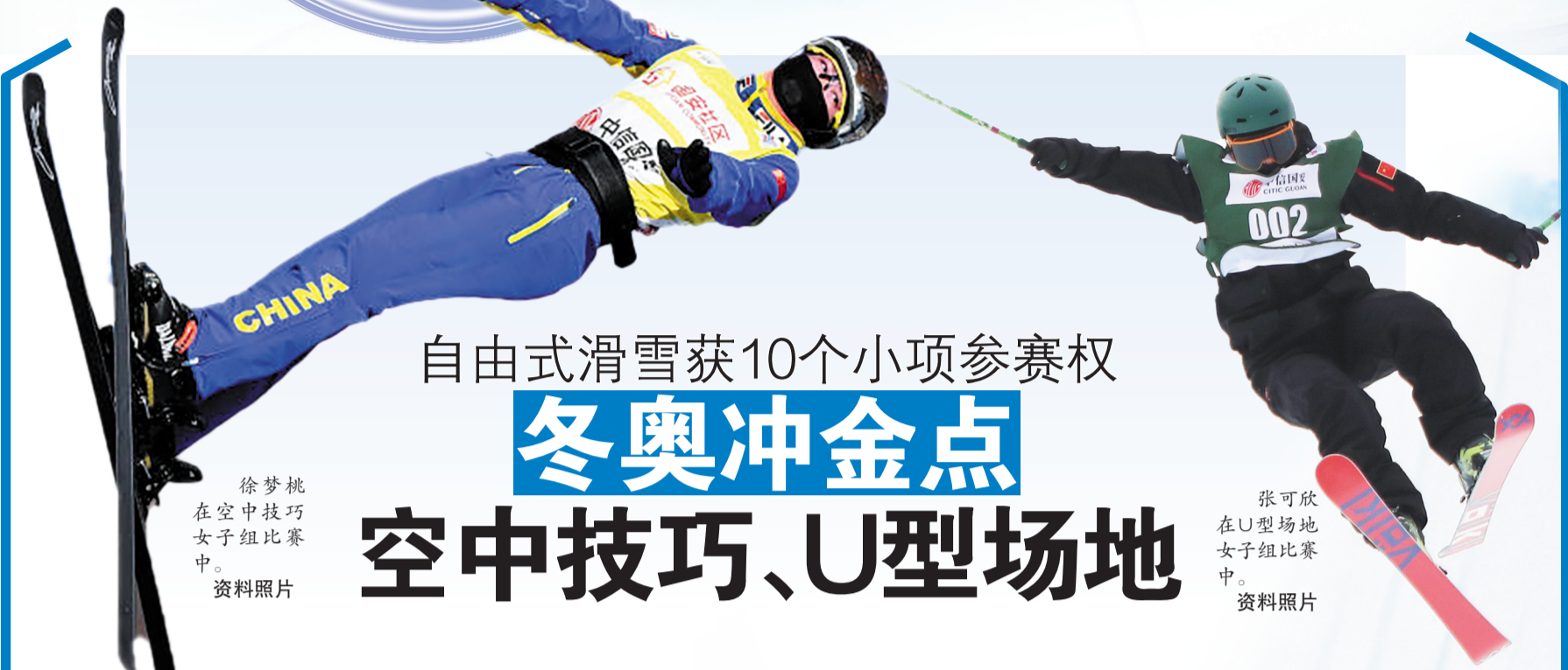
徐梦桃在空中技巧女子组比赛中。