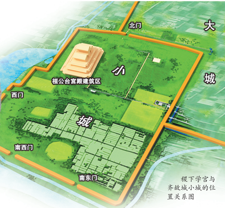
稷下学宫与齐故城小城的位置关系图