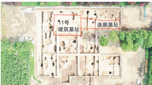
11号建筑基址与连廊基址