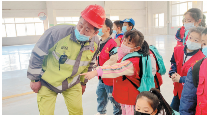
在卸料大厅,一名小记者向工作人员提问。

在一楼的转运大厅,小记者们看到一辆辆转运车井然有序地排列着,它们进来前首先要通过地磅称重,经过中央控制室、语音广播对进站车辆实行自动派位。“这个泊车位上面怎么还有红绿灯啊?它的作用是什么呢?这些垃圾都运到了什么地方?”一名小记者好奇地问。工作人员解释称:“这个装置如果显示红灯,说明垃圾装满了可以运走;如果是绿灯在闪,说明还能继续装垃圾。垃圾会直接运