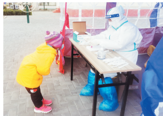
女童向“大白”阿姨鞠躬表示谢意。