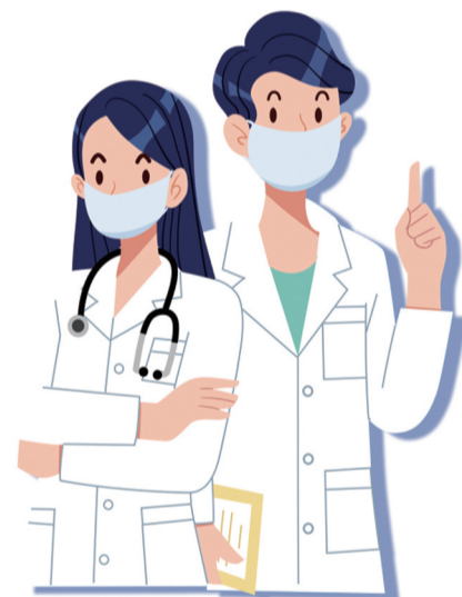
发现症状 及时就医