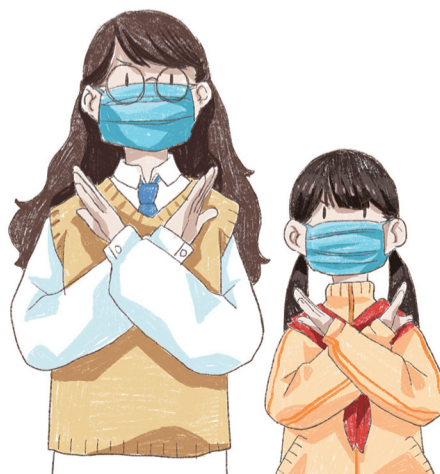
不信谣 不传谣 不瞒报