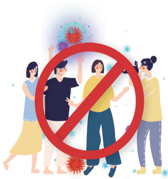
不扎堆 不聚集 保持安全距离