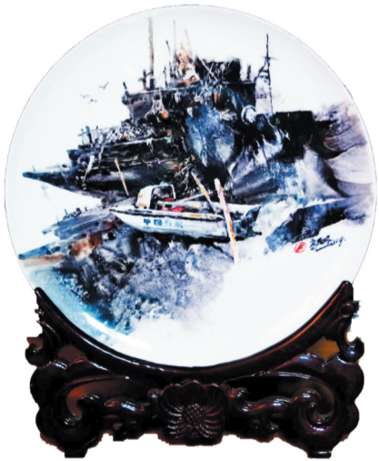
房敏陶瓷水彩作品