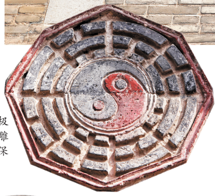
太极图砖雕雕刻精美,保存完好。