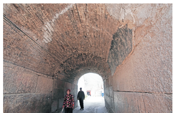
北阁子至今仍是进出村庄的重要通道。

成为重要的粮食和蔬菜种植区。东庵庙会每年农历四月初八、九月廿三各举办一次,四月初八的庙会更为盛大,唱大戏、商品买卖、骡马交易,十分热闹。随着时代变迁,如今的东庵已少有人问津,破败不堪,庙会也已停办多年,但当年的戏台得以保留,成为那个时代的见证。上世纪60年代,郭庄村曾大规模挖掘地道。全村13个生产队全部参与,最终用时90天完工,地道总长1020米,村里的主要道路下面几乎都有地道。然而,地道的存在也带来了安全隐患,前几年还发生了地道坍塌导致民房受损的情况。“郭庄村分成东西两个行政村后,大部分的历史建筑都留在了郭庄东村。除了韩家大院、东庵,村里还有观音阁、关帝庙。”韩新说,如果说厚重的历史是郭庄村的宝贵遗产的话,那么白菜、土豆、猕猴桃就是如今郭庄村的三件宝。郭庄东村2000多亩耕地大量种植蔬菜,从最初的茄子,到现在的白菜、土豆,蔬菜品种在变,高品质始终没变。近年来,在保持蔬菜种植特色的同时,郭庄东村大力发展猕猴桃种植,并于2017年成功举办首届“金郭庄”猕猴桃节,将猕猴桃打造成了村子的又一张名片。古建筑、古寺、地道、特色种植,同时拥有这些发展元素的郭庄东村,正在积极整合资源,续写“金”郭庄的传奇。大众日报淄博融媒体中心记者 王晓明 韩凯 王兵 通讯员 薛冰 刘海伟