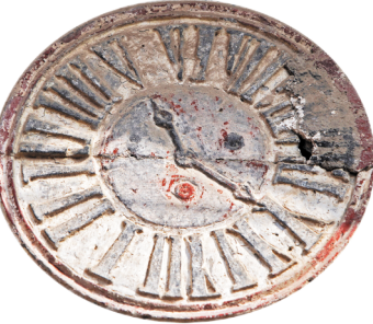
罗马时钟造型砖雕上的罗马数字未按钟表的数字顺序排列,让人捉摸不透。