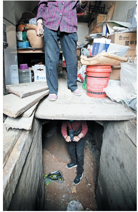
村中曾挖了许多地道,有些地道口在村民家中。如今村里正在设法将这些四通八达的地道开发成旅游资源。