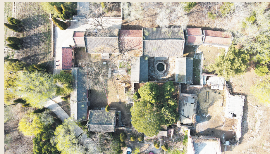
俯瞰坐落在山脚下的东庵