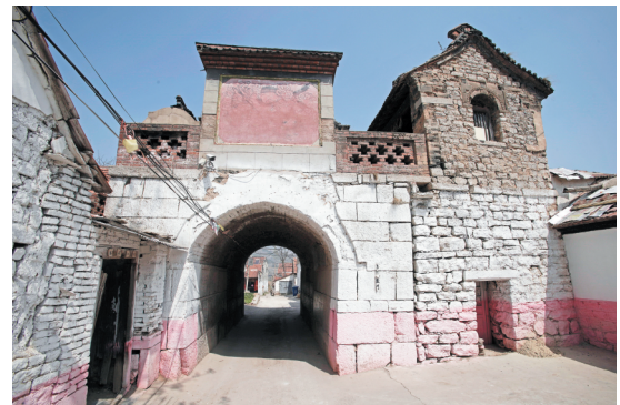
原来村子周围有高大的围墙,四面都有阁子(寨门),如今仅北阁子依然完好。