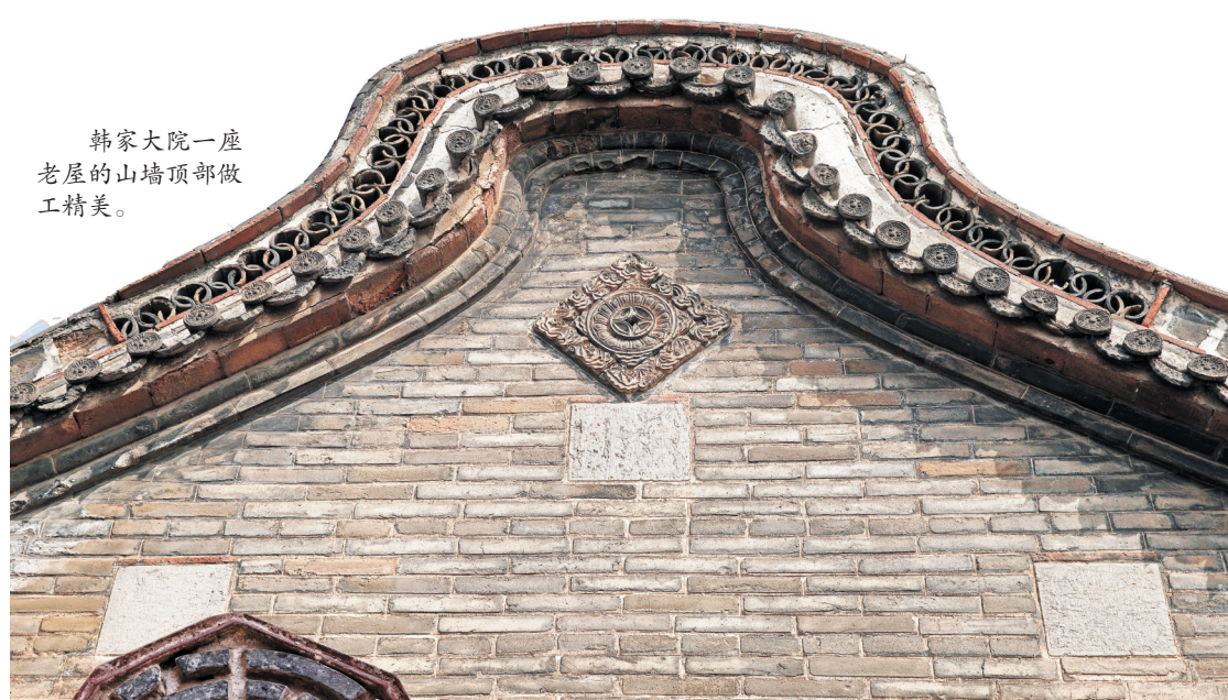
韩家大院一座老屋的山墙顶部做工精美。