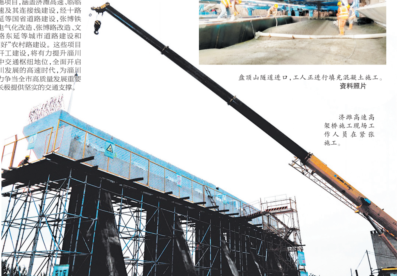
济潍高速高架桥施工现场工作人员在紧张施工。