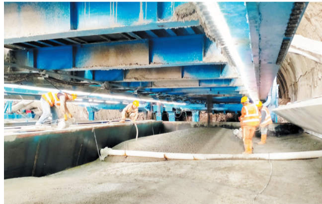
盘顶山隧道进口,工人正进行填充混凝土施工。