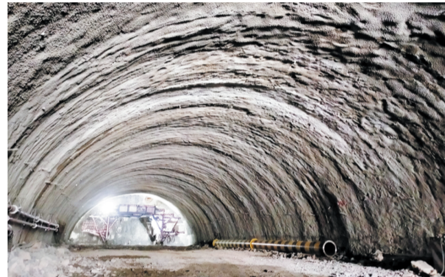
济潍高速盘顶山隧道施工现场 资料照片