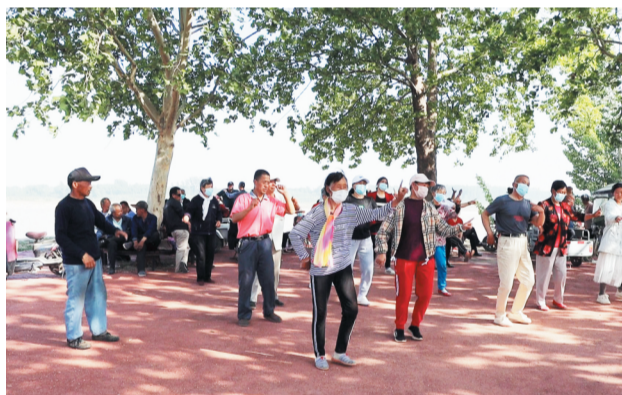
人们在黄河郊野公园健身休憩。

滨州市自然资源和规划局国土空间生态修复科工作人员告诉记者，滨州黄河淤背区土地面积1.5万亩，可绿化面积约1.3万亩。2021年春季实施黄河淤背区绿化提升工程，完成更新改造绿化面积4113.95亩，完善提升绿化面积1555.45亩，节点绿化面积269.32亩，平均造林成活率达到90%以上。通过黄河淤背区绿化提升建设，淤背区绿化缺乏、失管衰老、林相参差不齐、树种较为单一的情况得以明显改善，打造了以银杏、白蜡、国槐等树种为主的生态景观廊道，形成了“一段一景”的多树种块状混交林。