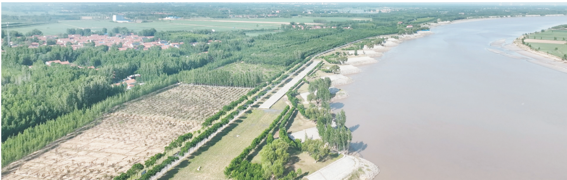
黄河经济技术开发区段