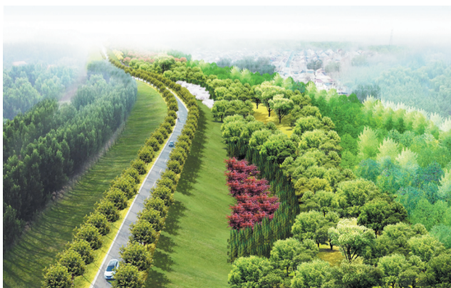
黄河郊野公园规划效果图