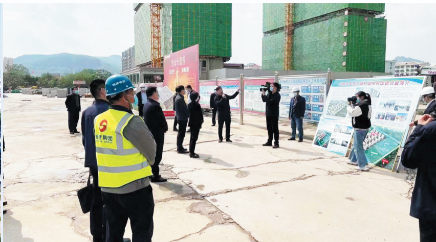
安置楼建设情况受到了各级党委政府的关心关注。 资料照片