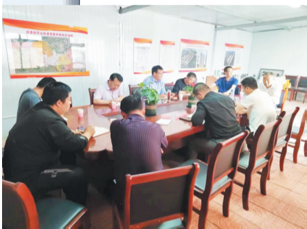
北麻新区党建共同体召开党委会议。 资料照片