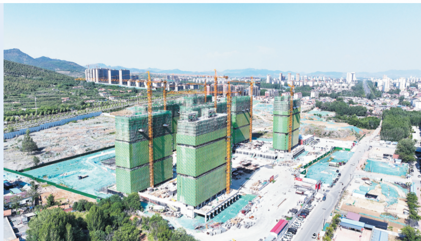
从空中俯瞰沂源县历山街道西北麻安置楼。