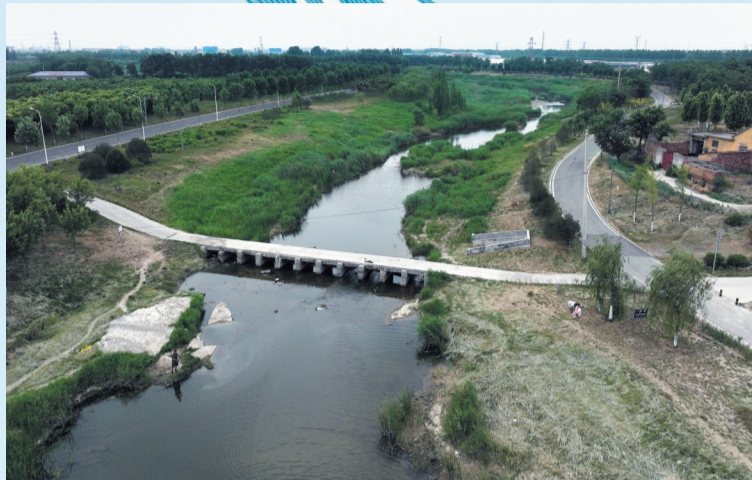
范阳河清泉村附近河段的一座小桥