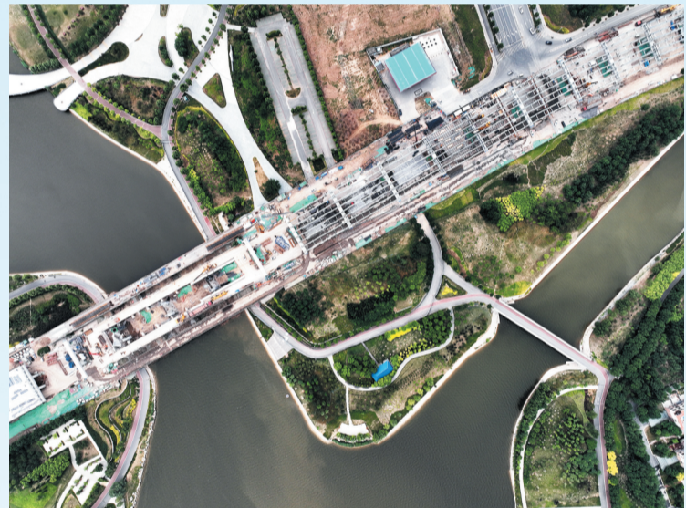
横跨孝妇河的快速路项目正在建设中,范阳河与孝妇河在此交汇。