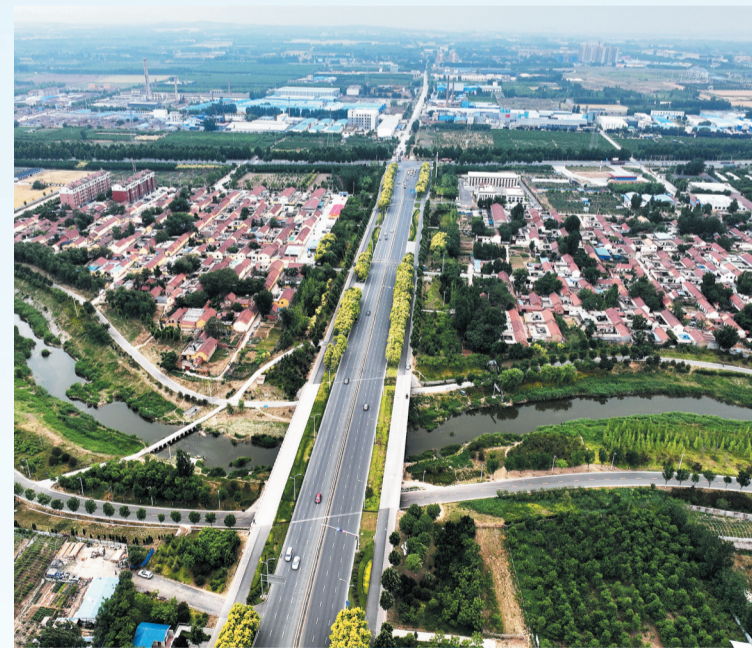
海岱大道跨范阳河而过。