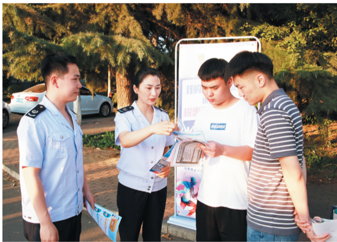
税务人员为高校毕业生讲解就业创业税费优惠等方面的政策。

下一步，桓台县税务局将继续充分发挥党建引领作用，扎实落实“春雨润苗”专项行动，以“税校互促”的合作新模式，构建完善的就业创业税费服务保障链条，实现纳税服务和孵化服务的有效对接，在毕