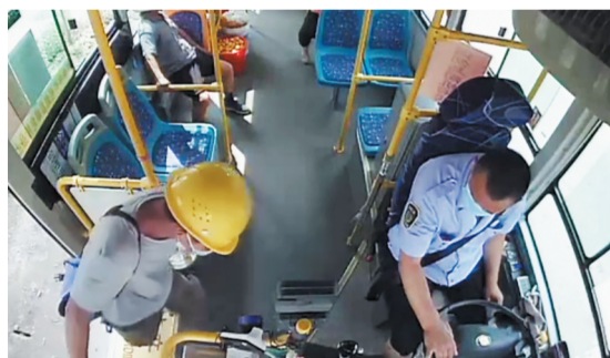
受伤男子捂着腹部上公交车。

大众日报淄博融媒体中心记者 张欣 孙渤海 见习记者 张靖怡 通讯员 程鹏 卢锦桥 视频截图