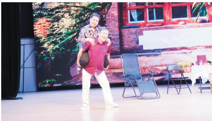
聊斋俚曲戏《三背娘亲》

此次活动贯彻落实省文化和旅游厅关于举办山东省群众性小戏小剧“大擂台”活动的有关要求,前期各区县通过各自“大擂台”活动进行作品的初步筛选、审核,并推荐1—2部群众性小戏小剧参加市级“大擂台”活动。参赛作品由专家进行评审,评选出一、二、三等奖,同时推荐5个优秀作品参加在临沂市沂南县举办的山东省群众性小戏小剧“大擂台”活动,并组织部分优秀获奖作品参加2022“齐舞·悦动”淄博文化艺