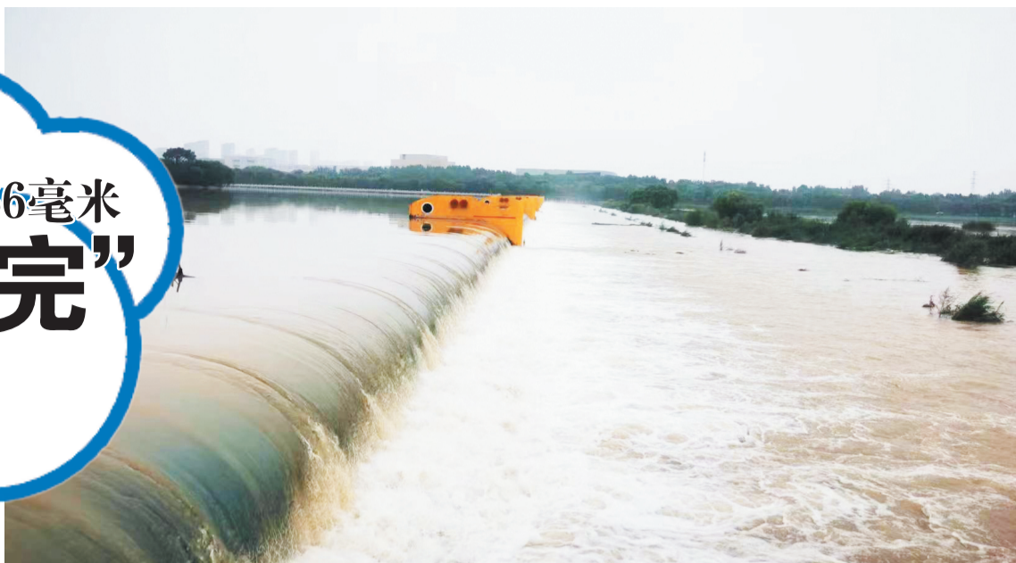
8月10日,受上游太河水库泄洪流量加大影响,太公湖水位上涨。