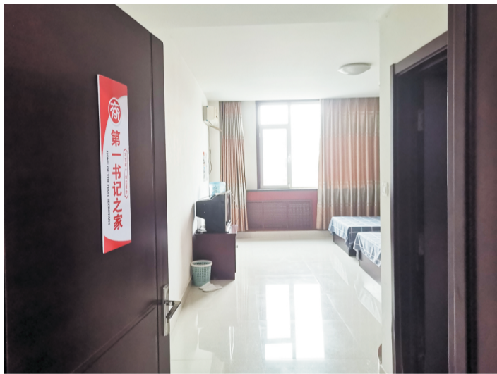
“第一书记之家”为“第一书记”提供了便利。