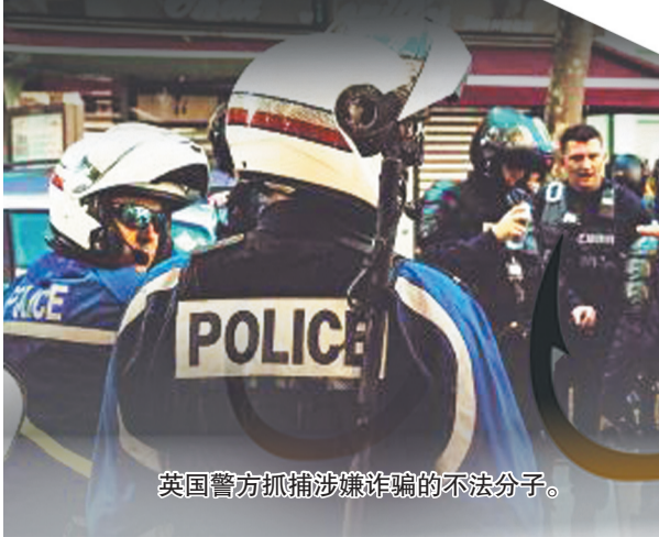
英国警方抓捕涉嫌诈骗的不法分子。