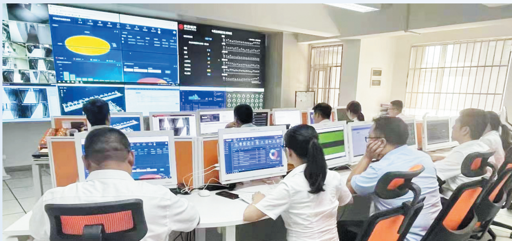
齐商银行信息科技部人员正在工作。