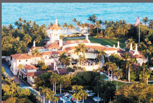
这是2017年3月22日拍摄的美国佛罗里达州棕榈滩海湖庄园。

共和党方面指责司法部和FBI的执法行动出于“政治动机”，指责民主党人对特朗普发动“政治迫害”以阻止他再次竞选总统。