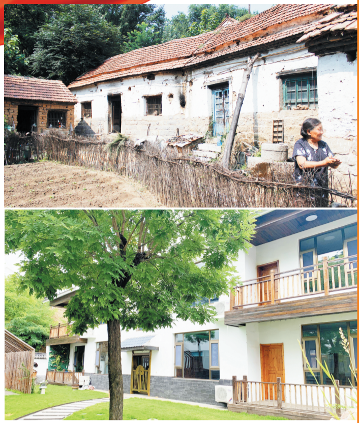
上图为中郝峪村原来的老房子。下图为十年后村里旧貌换新颜。