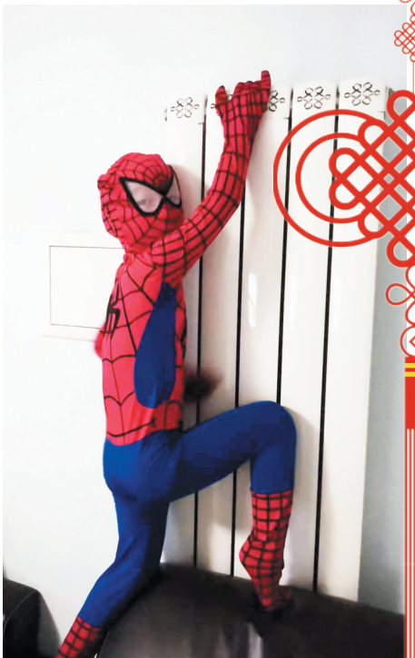
可爱的孩子是美好生活给予的最好礼物。