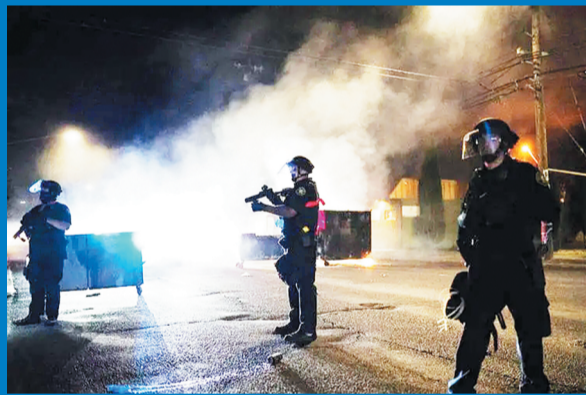
美国警察持枪执法。

误伤或误杀人质、受害者虽跟击毙“嫌疑人”性质不同,但深究其背后原因,都跟美国警方的体制及其暴力执法习惯、警察问责机制等有关。