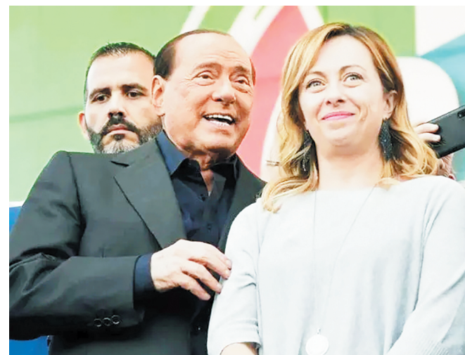
梅洛尼与贝卢斯科尼(中)一同参加活动。