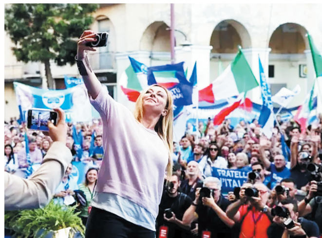
梅洛尼在竞选活动上与支持者自拍。