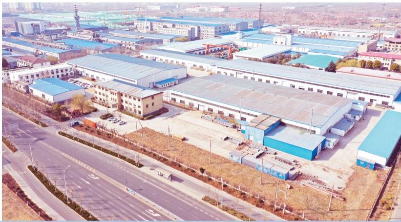
张店经开区低效用地转移出清之前。资料照片