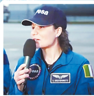
萨曼莎在机场接受采访。