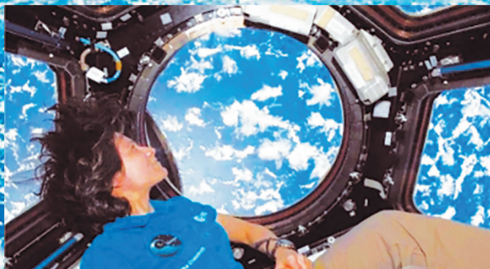
Samantha Cristoforetti @AstroSamantha

10月15日，萨曼莎·克里斯托福雷蒂返回地球，她在机场接受中央广播电视总台中国国际电视台记者采访时表示，“选这句诗要感谢我的好朋友，一位在中国生活了30年的意大利汉学家。他在中国文学上造诣非凡，他建议我选这个诗句，这个选择非常准确。”