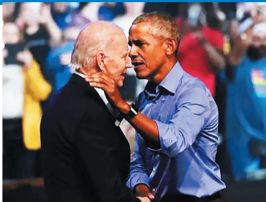
拜登(左)与奥巴马同台造势。

就目前情况来看,拜登及民主党面临诸多挑战,局势不容乐观:在美国遭遇40年来最严重通胀、前总统特朗普高调回归、最高法院推翻对堕胎权保护的背景下,民主党能否守住两院的微弱优势很难说,这将直接影响拜登接下来两年的任期,甚至2024年的总统选举。