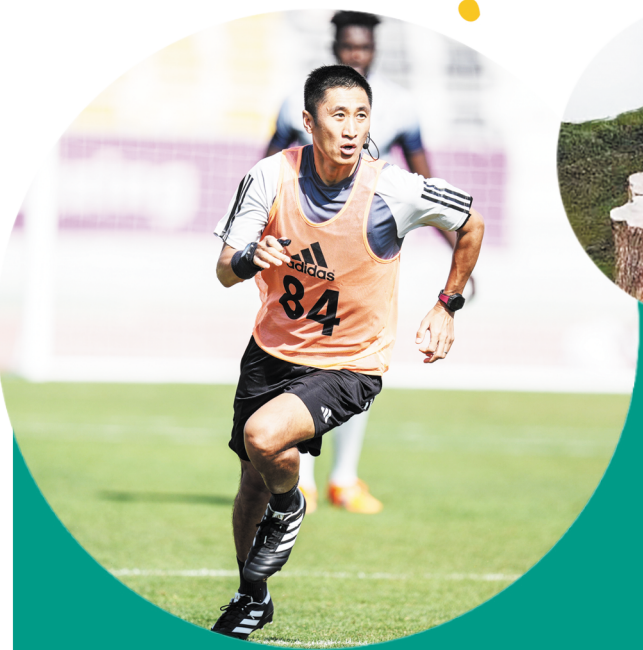
中国裁判马宁在训练中。