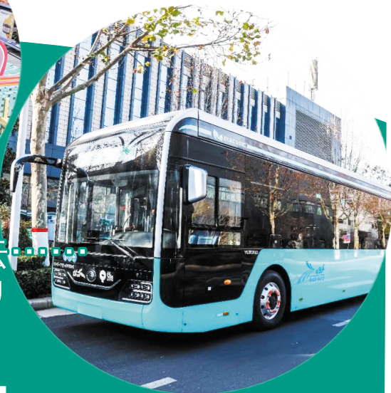
多哈街头的中国品牌纯电动公交车