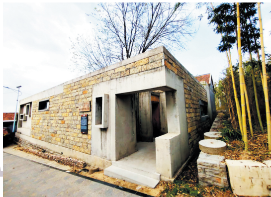
位于沂河源龙子峪的保罗与娜蒂之家