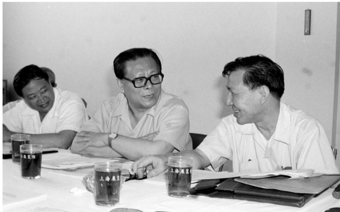
1985年,江泽民同志在上海市八届人大四次会议上。

基本养老保险制度和基本医疗保险制度,健全失业保险制度和城市居民最低生活保障制度,探索建立农村养老、医疗保险和最低生活保障制度。