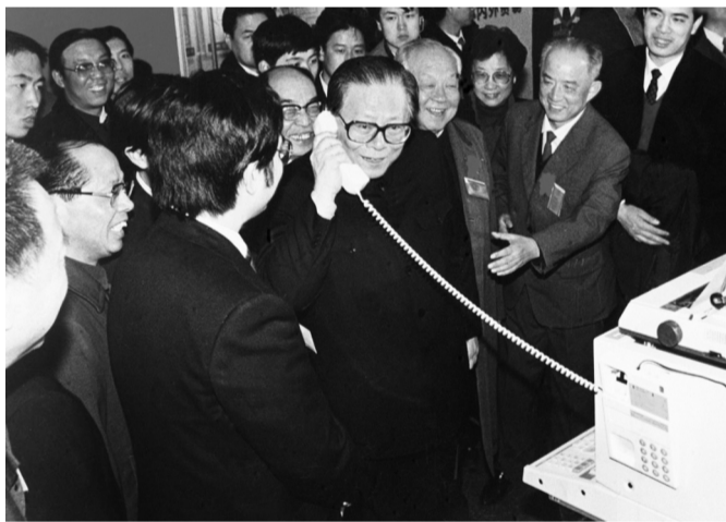
1984年5月,江泽民同志在北京展览馆举行的全国电子产品展览会上,试用国际长途电话向远方的工作人员问候。