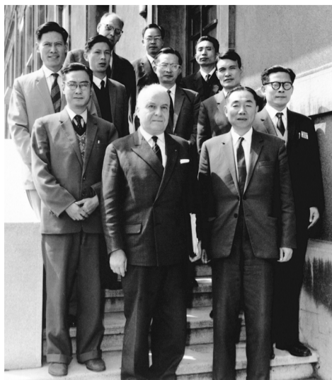
◀1964年6月,江泽民同志(二排右一)在法国艾克斯莱班出席国际电工委员会会议期间与会代表合影。

江泽民结合新的实践,进一步深化了对我国社会主义改革的理论思考。他指出,认真总结苏联解体、东欧剧变的教训,以及我们发生“文化大革命”这样严重曲折的教训,深刻分析它们的原因,可以得出两条结论:一是必须坚持社会主义;二是必须进行社会主义改革,探索符合本国实际的社会主义发展道路。他强调,创新是一个民族进步的灵魂,是一个国家兴旺发达的不竭动力,必须坚定不移推进各方面改革,改革要从实际出发,整体推进,重点突破,循序渐进,注重制度建设和创新。20世纪90年代,他以中国共产党人坚持理论创新、与时俱进的巨大勇气,确立了社会主义市场经济体制的改革目标和基本框架,确立了社会主义初级阶段公有制为主体、多种所有制经济共同发展的基本经济制度和按劳分配为主体、多种分配方式并存的分配制度,开创全面改革开放新局面。1992年6月,他提出对高度集中的计划经济体制进行根本性的改革势在必行,不然就不可能实现我国的现代化,根据邓小平南方谈话精神,他明确提出使用“社会主义市场经济体制”这个提法,为中共十四大召开做了重要的思想理论准备,中共十四大正式把建立社会主义市场经济体制确立为中国经济体制改革的目标。中共十四届三中全会通过的《关于建立社会主义市场经济体制若干问题的决定》,制定了建立社会主义市场经济体制的总体规划。到20世纪末,我国已初步建立了社会主义市场经济体制的基本框架。江泽民指出,公有制为主体、多种所有制经济共同发展,是我国社会主义初级阶段的一项基本经济制度;公有制实现形式可以而且应当多样化;股份制是现代企业的一种资本组织形式,资本主义可以用,社会主义也可以用。必须毫不动摇巩固和发展公有制经济,必须毫不动摇鼓励、支持和引导非公有制经济发展。他强调,改革国有资产管理体制是深化经济体制改革的重大任务,要在坚持国家所有的前提下充分发挥中央和地方两个积极性。他指出,国有企业是我国国民经济的支柱,国有企业改革是我国经济体制改革的中心环节,要着眼于搞好整个国有经济,抓好大的,放活小的,对国有企业实施战略性改组。他指出,建立现代企业制度是国有企业改革的方向,要按照“产权清晰、权责明确、政企分开、管理科学”的要求,对国有大中型企业实行规范的公司制改革,使企业成为适应市场的法人实体和竞争主体。他提出,充分发挥市场机制的作用和加强宏观调控都是建立社会主义市场经济体制的基本要求,要加快健全和完善宏观调控体系,深化金融、财政、计划体制改革,完善宏观调控手段和协调机制,实施适度从紧的财政政策和货币政策,注意掌握调控力度。他强调,理顺分配关系事关广大群众的切身利益和积极性的发挥,要完善按劳分配为主体、多种分配方式并存的分配制度,坚持效率优先、兼顾公平,建立健全同经济发展水平相适应的社会保障体系,完善城镇职工