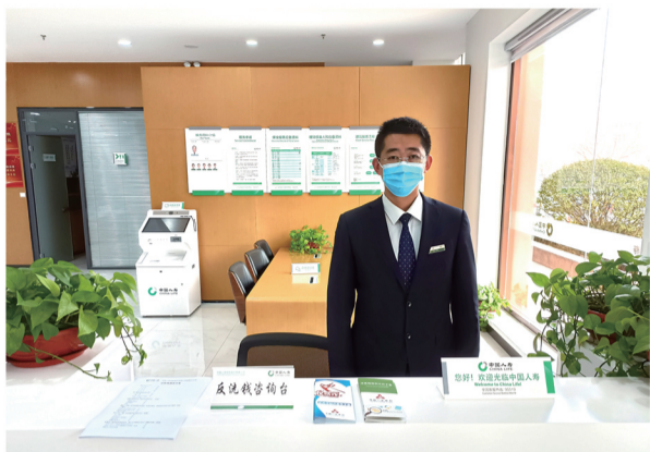
中国人寿淄博分公司客户服务中心反洗钱咨询台

反洗钱不仅关乎老百姓的钱包，还是国家治理体系和治理能力现代化的重要内容，是维护经济社会安全稳定重要保障。近年来，反洗钱工作更是在扫黑除恶、反逃税、反腐败及打击电信诈骗等涉众型犯罪方面显现出了重要作用。2022年，中国人寿淄博分公司始终坚持“标本兼治、综合治理、惩防并举、注重预防”的方针，严格履行反洗钱义务，树立全员打击洗钱意识，将安全防范融入日常工作中，提高反洗钱技能，努力从源头上防范各类金融风险案件的发生。