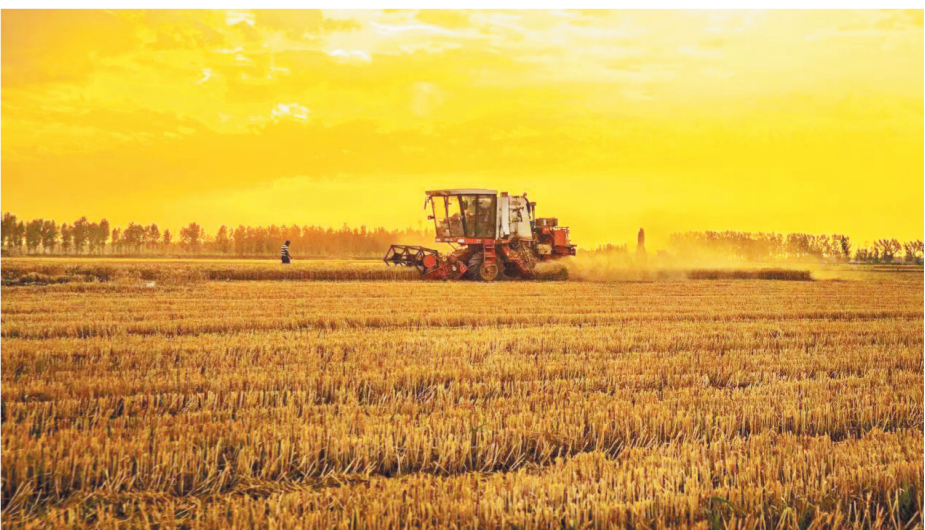
田野里的丰收场景