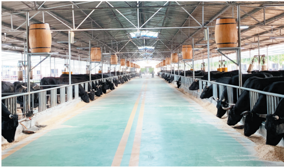
规模化的黑牛养殖