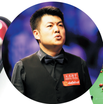
中国斯诺克球员梁文博