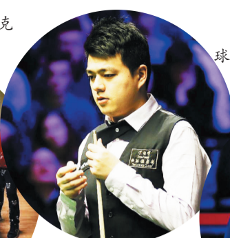
中国斯诺克球员鲁宁