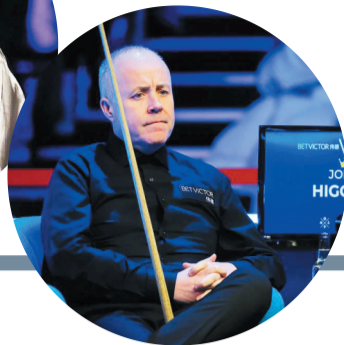
名将希金斯曾因涉赌被禁赛。