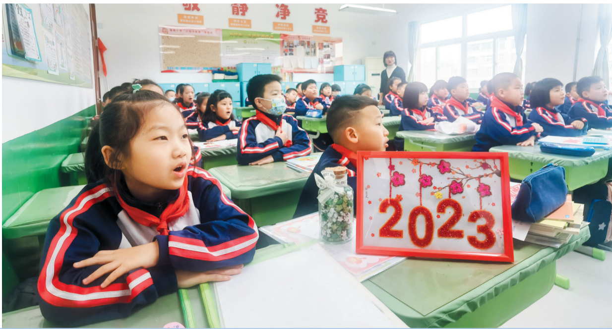
潘南小学学生上开学第一课。