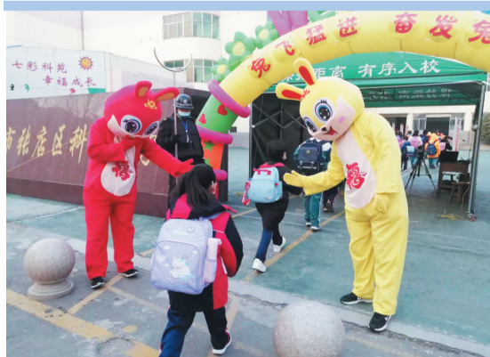
张店区科苑小学老师打扮成卡通形象欢迎学生返校。