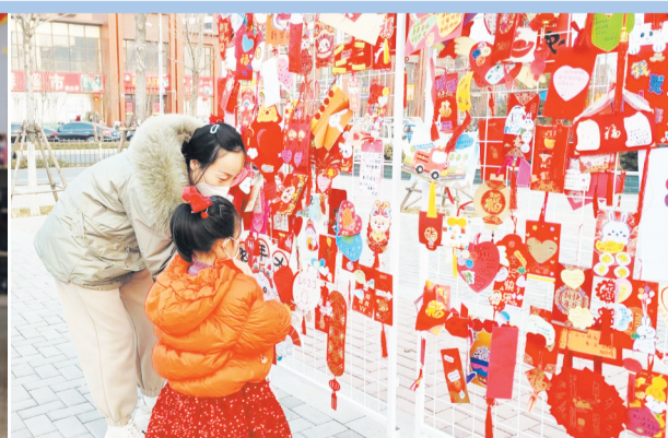
临淄区实验幼儿园的家长和孩子正在挂心愿卡。