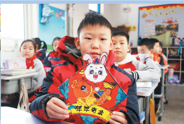
高新区实验小学学生正在展示寒假创作的作品。